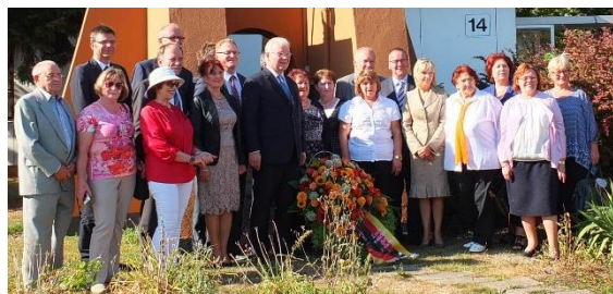
Zentrale Gedenkfeier der Landsmannschaft der Deutschen aus Russland e.V. in Friedland am 3.9.2016

über die ehemaligen so genannten Gastarbeiterinnen und Gastarbeiter aus der Türkei oder Griechenland, aus Italien, Spanien oder dem ehemaligen Jugoslawien bis hin zu den geflüchteten Menschen aus Syrien, dem Irak oder Eritrea. Dass ihre Interessen in Politik und Gesellschaft berücksichtigt werden und ihre wirtschaftliche, soziale, rechtliche und gesellschaftliche Integration gewährleistet wird und bleibt, ist Kernziel meiner Arbeit . Und diese gestaltete sich mit insgesamt rund 260 Terminen aller Art auch im Jahr 2016 überaus vielfältig.