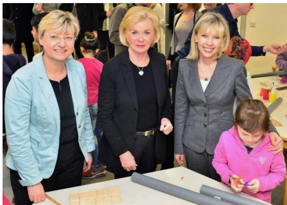
„Musik, Sprache, Teilhabe“: Vorstellung eines Pilotprojekts durch Niedersachsens Kultusministerin Frauke Heiligenstadt, die stv. Vorstandsvorsitzende der Bertelsmann-Stiftung Liz Mohn und Doris Schröder-Köpf bei einem Besuch in der Erstaufnahmeeinrichtung des Grenzdurchgangslagers Friedland am 4.2.2016.

Viele weitere Angebote zur sprachlichen Integration (z.B. der TUI-Stiftung und der Deutschlandstiftung ) sind in diesem Jahr in Niedersachsen entstanden. Ich unterstütze sie gerne. Das vom Niedersächsischen Sozialministerium und dem interkulturellen Verein Can Arkadas herausgegebene „Sprach- und Integrationsbuch“ ist ein praktischer Begleiter für alle Lebenslagen auf Deutsch und Arabisch. Das Buch ist eines von vielen niedrigschwelligen Integrationsprojekten, die von der Lotto-Sport-Stiftung gefördert werden. Deshalb freue ich mich auch besonders, als Mitglied im Stiftungsrat die wichtige Arbeit der Stiftung mitgestalten zu können.