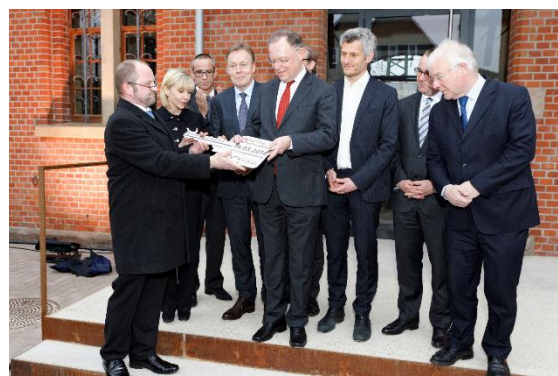
Einweihung des Museums Friedland am 18. März 2016

wider wie Friedland. Denn hier, am Südzipfel unseres Bundeslandes, begann nach dem Ende des Zweiten Weltkriegs für Millionen von Menschen ein neues Leben. An diese Geschichte erinnert seit 2016 das Museum Friedland , ein einzigartiges Projekt, auf das wir Niedersachsen über alle Parteigrenzen hinweg stolz sein können, weil es sich – bundesweit einmalig – explizit dem Themenkomplex Flucht, Vertreibung, Migration und Integration widmet. So war es für mich eines der Highlights in diesem Jahr, mit Ministerpräsident Stephan Weil, Innenminister Boris Pistorius und Landtagspräsident Bernd Busemann bei der festlichen Museumseröffnung am 18. März im historischen Bahnhofsgebäude unter dem Motto "Abschied, Ankunft, Neubeginn" dabei gewesen zu sein.