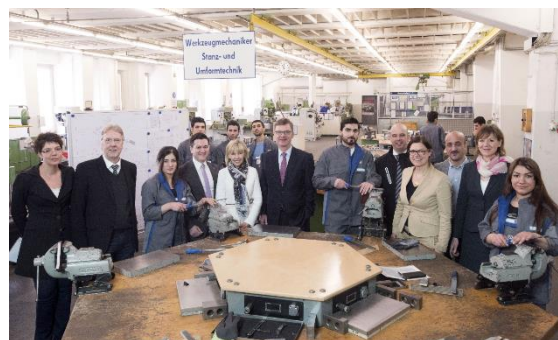
Unterstützung von Integrationsprojekten: Besuch der Werkstätten von VW Nutzfahrzeuge am 14. März 2016 in Hannover, wo geflüchtete Menschen im Rahmen des SPRINT-Projekts der niedersächsischen Landesregierung eine Ausbildung erhalten

Die Integration geflüchteter Zuwanderer markiert eine der größten politischen Querschnittsaufgaben der niedersächsischen Landespolitik in jüngster Zeit. Bildung, Arbeit, Freizeit, Wohnen, Politik, Religionsausübung und gesellschaftliche Teilhabe: All diese Handlungsfelder der Integrationspolitik spiegeln sich natürlich auch in meiner Arbeit wider. Ein besonderer Themenschwerpunkt bildete allerdings die Arbeitsmarktintegration . In zahlreichen Gesprächen und Konferenzen habe ich mich darum bemüht, Unternehmen oder Projektträger, die Geflüchtete zügig in Arbeit bringen möchten, mit Mitarbeiterinnen und Mitarbeitern der Landesregierung im Bereich der Wirtschaftsförderung und den regionalen Entscheidungsträgern der Bundesagentur für Arbeit zusammenzubringen.