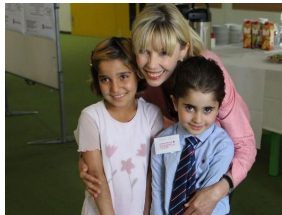
Treffen mit jungen Bewohnern des Geflüchtetenwohnheims in Hannover-Ahlem anlässlich der Übergabe von „Bildungsrucksäcken“ am 16. Juni 2016

Stütze unserer Gesellschaft. Und so war es mir ein besonderes Anliegen, auf die große Bedeutung des Ehrenamtes für unser Gemeinwesen aufmerksam zu machen, den freiwilligen Helferinnen und Helfern mit Unterstützung zur Seite zu stehen (siehe etwa den „Ratgeber für Ehrenamtliche“ aus 2015) und ihnen dankende Anerkennung zu zollen – ob beim Niedersächsischen Integrationspreis , der Aktionswoche von „Niedersachsen packt an“ , im Rahmen von Schirmherrschaften wie z.B. die über den TakeOff-Award in Berlin oder bei Besuchen von Flüchtlingseinrichtungen wie in Oldenburg-Etzhorn .